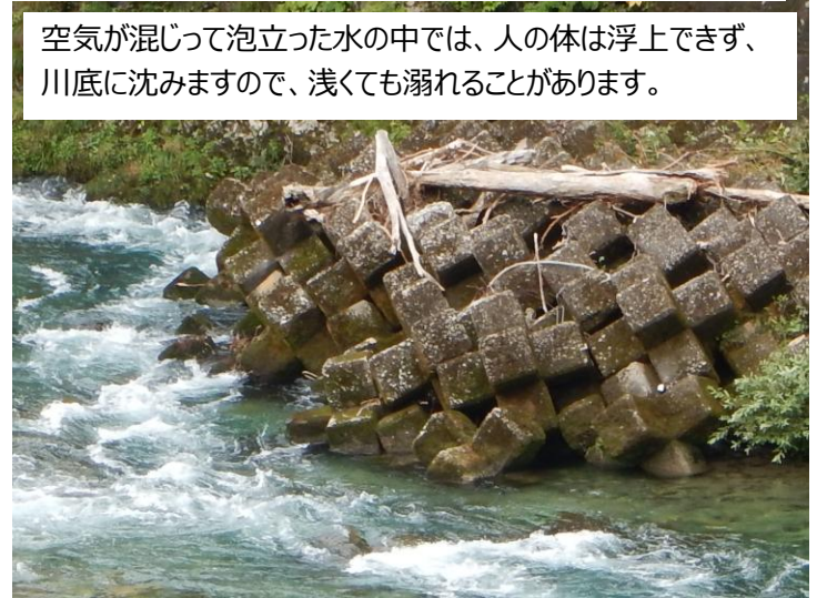
午渡橋上流 護床ブロック