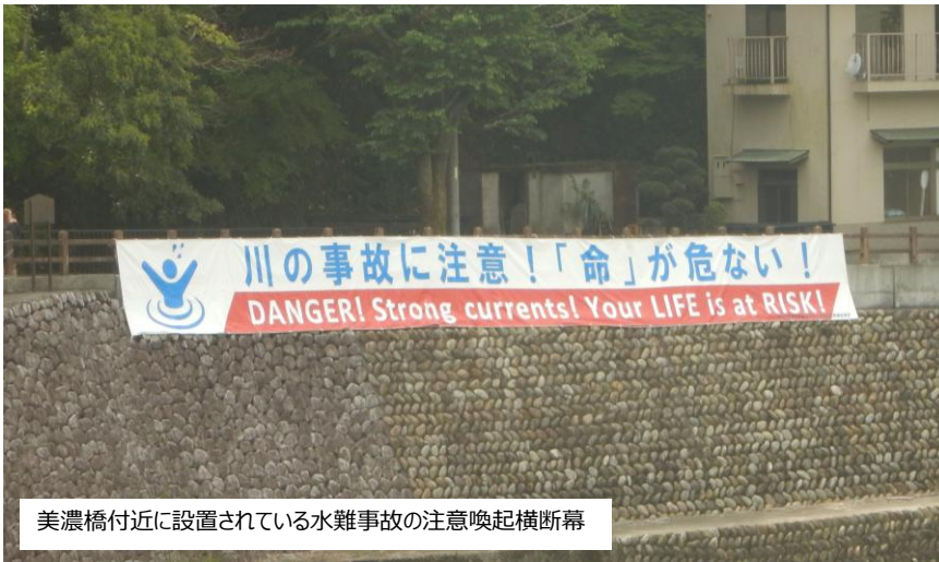
美濃橋付近に設置されている水難事故の注意喚起横断幕

右岸河原から一気に淵に向かって急に傾斜がついている。また岩場が入組み、複雑な流れを水面下で発生させている。