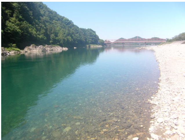
河原があり浅いように見えるが、岩場の淵に向かって一気に水深が深くなっている。

川の流速、温度は一定ではなく、川底には岩や深い溝があり、渦が発生するなど、流れは複雑です。絶対に、対岸へ泳いで渡ろうとしないでください。