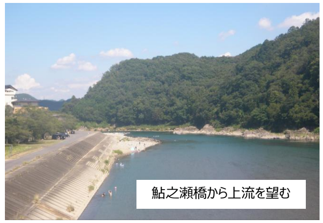
鮎之瀬橋から上流を望む