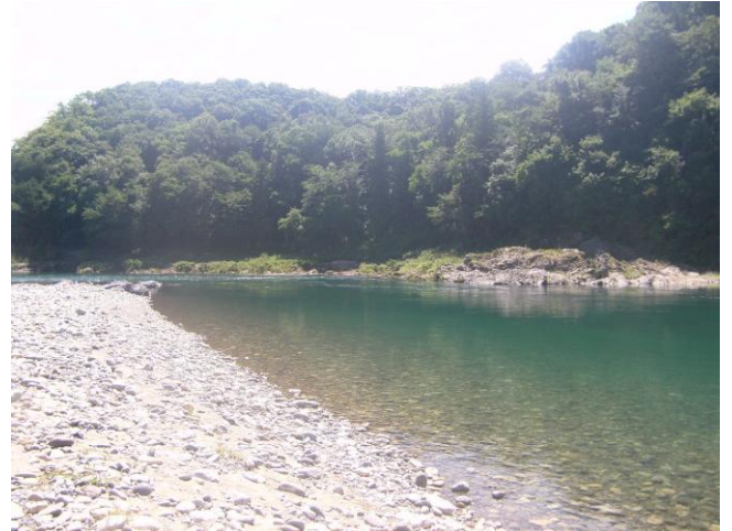
岩場が多い湾曲部には、淵が形成されており、水の流れが複雑になっている。