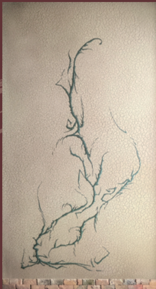
ウクライナに捧ぐ W110×H200 cm 2022年