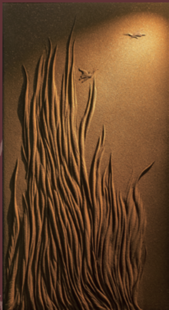
帰蝶 W119.5×H210.5 cm 2017年