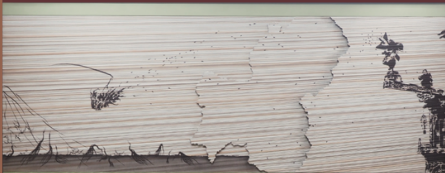
挾土秀平作「岐阜に舞う」(岐阜県庁1Fエントランス 2022)