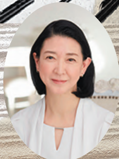
岐阜県図書館 名誉館長 「清流の国ぎふ」文化祭2024応援大使 紺野美沙子氏