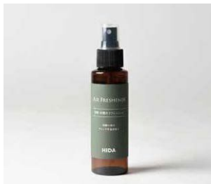
エアフレッシュナー