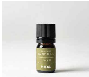
エッセンシャルオイル ヒノキ木部