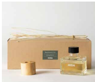
フレグランスセット (リビングルーム)