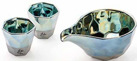
プラチナブルー冷酒器セット (盃・冷酒器)

風情と感性を凝縮した唯一無二の器で、いつもの食卓をちょっと特別なものにしてみませんか。