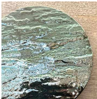
岩目プレート トルコ青

抜きの難しい黒土を圧力鑄込みで成型しています。酒器、カップ、盃は内側も亀甲型のため、高度な技術を要し、一度施釉と焼成を行ったのち、更には絵焼成で鏡面加工を施した商品は正に唯一無二の存在です。自然の岩を切り出したような陶板プレートは、そのまま料理を盛り付けても、重ね使いにしても良い逸品。職人のこだわりと技術が詰まった商品は、きっとお客様の食卓を特別なものにしてくれるでしょう。