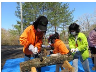
しいたけの菌打ち