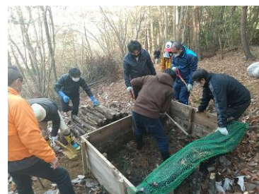
カブトムシ小屋の整備