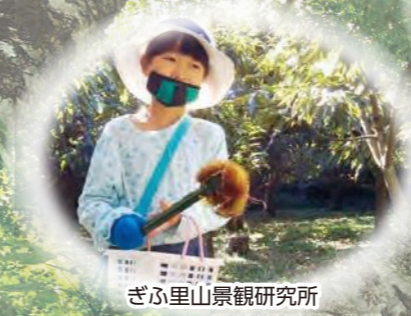
ぎふ里山景観研究所