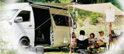
(株)トイファクトリー トイの森