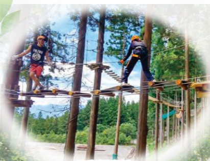
東和観光(株) 鷲ヶ岳アルプスアドベンチャー

各種セミナーや、会員や異業種との交流会を開催し、人脉形成やビジネスパートナーの発掘をお手伝いします！