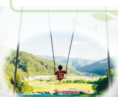
金亀商事(株) せせらぎキャンプ場