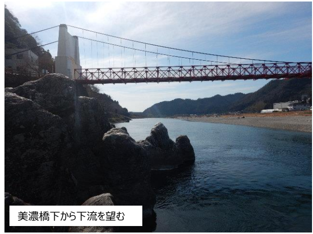
美濃橋下から下流を望む

両岸にくつろげる河原が形成、その間を釣り人が立てるほどの平瀬があるが、下流に進むと一気に深い淵となり、川床から岩場が発達し、複雑な流れを発生させている。