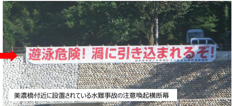
美濃橋付近に設置されている水難事故の注意喚起横断幕

県では、これまでも水難事故の防止を図るため、水難事故が予想される箇所における注意喚起看板の設置や河川利用者への啓発活動に取り組んできましたが、美濃橋付近では、特に多くの水難事故が発生していることから、令和2年8月に大型の注意喚起横断幕（縦2m×横2.2m）を設置しました。