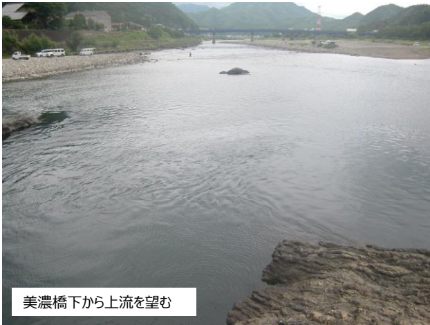
美濃橋下から上流を望む

両岸にくつろげる河原が形成、その間を釣り人が立てるほどの平瀬があるが、下流に進むと一気に深い淵となり、川床から岩場が発達し、複雑な流れを発生させている。