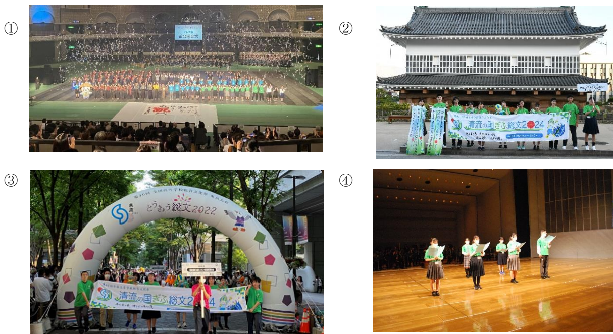
①2023かごしま総文プレ大会総合開会式