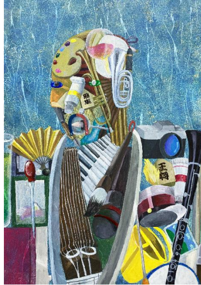
岐阜総合学園高等学校 3年 井上 みらい