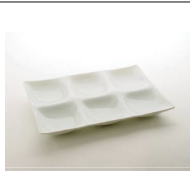
【コワケ 六つ仕切り皿】