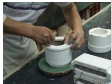
【鑄込みによる成型風景】