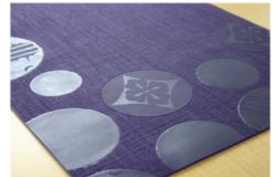
【ランチョンマット】