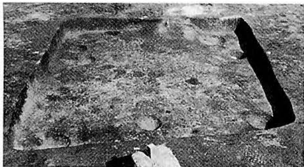
平安時代の竪穴住居跡

本年度は、本遺跡の東南にあたる地区の発掘調査を実施しています。前年度の試掘調査により、遺跡の規模は推定できましたが、竪穴住居跡以外の掘立柱建物跡や水場遺構、耕作地の位置などの遺跡の具体的な性格については不明な点が多いので、これらを解明する遺構の検出に重点をおいて調査を実施しています。現在の調査は、環境を伴う可能性をもった弥生時代中期の住居跡、古代の住居跡、中世の溝などを精査中であり、大きな成果が期待できそうです。