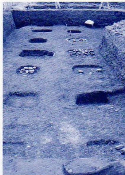
美濃国府跡 四面庇付大型建物跡 検出状況