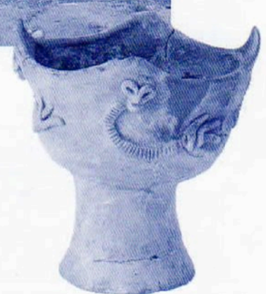
堂ノ前遺跡出土「動物意匠文土器」