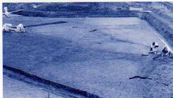
西屋敷遺跡 畦畔検出状況

本遺跡は、東海環状自動車道建設事業に伴う発掘調査で、昨年度の試掘調査によって、中世の水田面が確認されています。本遺跡の周辺には、国指定史跡の弥勒寺跡や関市の史跡公園となっている塚原遺跡があります。