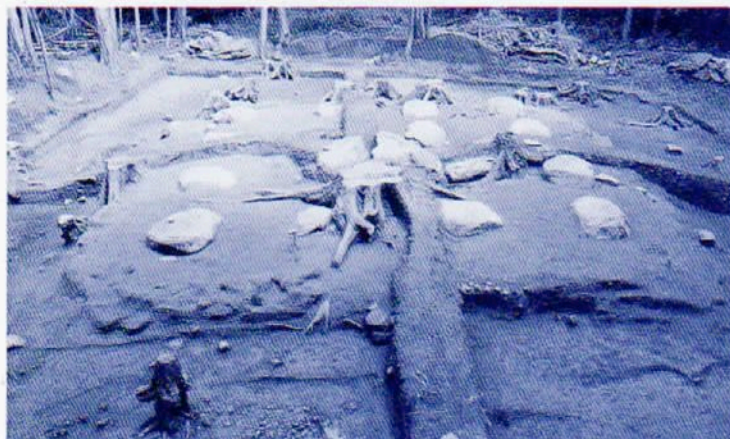
正家庵寺塔跡 検出状況