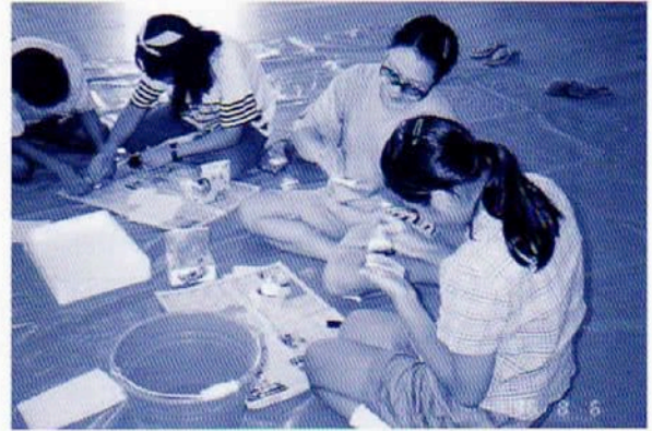
拓本実習に取り組む探検隊員

ここに、探検隊の活動を終えた子どもたちや保護者の方々から寄せられた感想を紹介します。