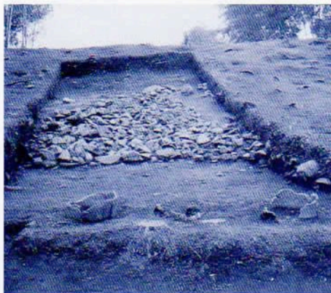
屋敷大家古墳 墓石(後方)・埴輪列(前方) 検出状況

震災復興事業にあたって、破壊される可能性のある「被災遺跡」は280遺跡、250haにのぼる。復興が順調か否かは一概には言えないが、兵庫県の人々の発掘調査に対する関心は高く、ある現地説明会では600名以上の参加者があった。しかし、震災の被害は大きく、心の傷はまだ癒えない。