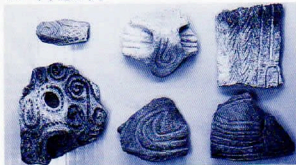
塚奥山遺跡 出土土器

また、試掘調査によって、3層より下に縄文時代の包含層が確認されています。特に、遺跡の西南部では、比較的浅い位置から縄文時代後期後葉の土器がまとまって出土しています。今後、この付近を中心に後期後葉の包含層の広がりを確認していく予定です。