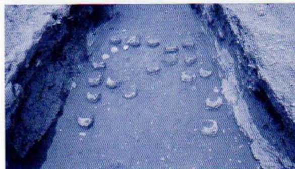
大沢13号古窯跡 検出状況

また、神明洞1号炭焼窯は、全長約3m、幅約2mで、平坦な床面をもち、煙道部は煙突状に垂直につくられていました。炭焼窯のため、遺物はほとんど出土しませんでした。灰原の最下層から13世紀代と考えられる数点の山茶碗片が出土しており、炭焼窯としては年代の特定できる貴重な資料といえます。