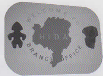
WELCOME TO HIDA