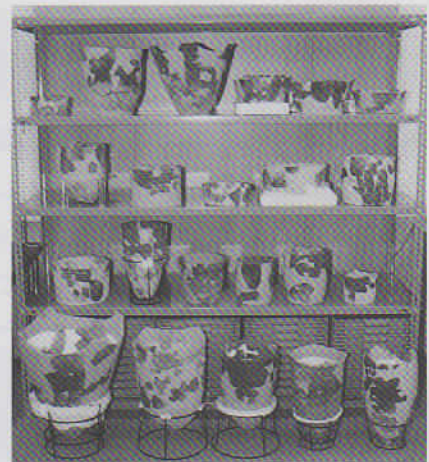
縄文時代早期の土器

本館の上段に建つ収蔵庫には飛驒地方で発掘調査した遺跡の遺物を収蔵しています。縄文時代の遺物が中心です。