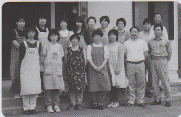
飛驒出張所の職員と整理作業員

高山市から国道41号線を北に走ると吉城郡国府町に入ります。“滝のしぶきと金蔵獅子の舞う飛驒国府”と町のキャッチフレーズにもあるように国宝安国寺経蔵や金蔵獅子の舞など有形無形の文化財が豊富な町です。飛驒出張所は町の南東の山裾にあります。出張所本館は軽量鉄骨平屋建で、クリーム色の外壁が背後の山々に映えています。飛驒地方の開発事業増大にともなう埋蔵文化財の記録保存を行うため平成8年1月に完成しました。