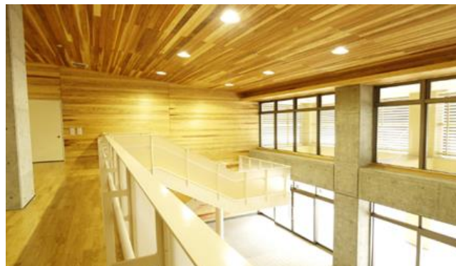
生徒昇降口吹き抜け