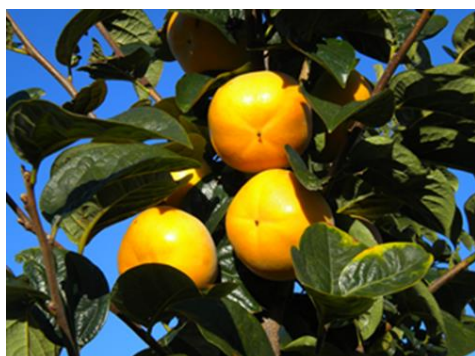
「ねおスイート」果実