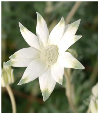
「ファンシーマリエ」花拡大