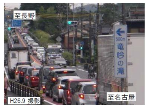
▲並行する国道19号 【釜戸交差点渋滞状況(下り)】