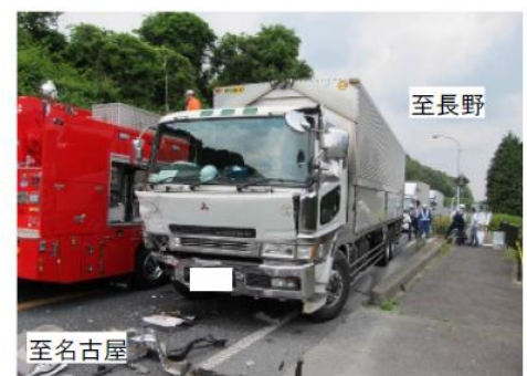
▲並行する国道19号 【正面衝突事故発生状況】