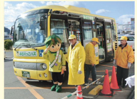
みどりっこバスとみどりっこちゃん

高齢化が進む団地において、通院・買い物などの足となるコミュニティバス。「みどりっこちゃん」という芥見地区オリジナルのキャラクターをつくり、バスの名前につけている。行き先案内や、乗り降りの手伝いなど、ボランティア（夏休みなどは中学生も参加）によるみどりっこヘルパーが困っている人をサポート。