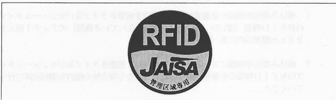
図3 管理区域専用RFID機器用ステッカ

注1：ここでは、公共施設や商業区域などの一般環境下で使用されるRFID機器を対象としており、工場内など一般人が入ることができない管理区域でのみ使用されるRFID機器（管理区域専用RFID機器）については対象外としている。なお、管理区域専用RFID機器については、（一社）日本自動認識システム協会において、一般環境への流出を防止するため、取扱説明書等に注意書きを記載するとともに、管理区域専用RFID機器用ステッカ（図3）を貼付することとされている。