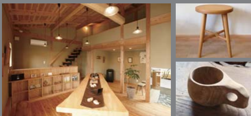
長野県産 唐松を使用した空間にもご注目下さい!

長久手Studioに併設された「木まま工房」にて、岐阜県内の作家によるクラフトショップがオープンします! 営業時間 10:00~18:00 定休日:水曜日