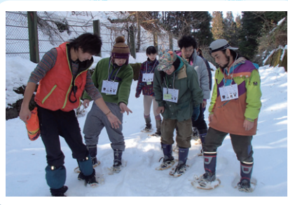
〈写真はすべてイメージです〉