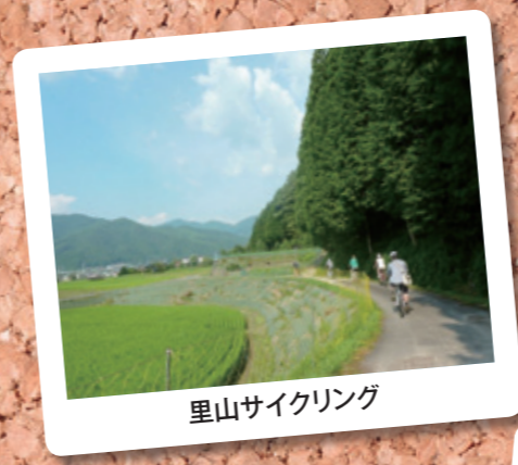
里山サイクリング