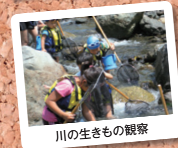
川の生きもの観察