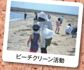
ビーチクリーン活動