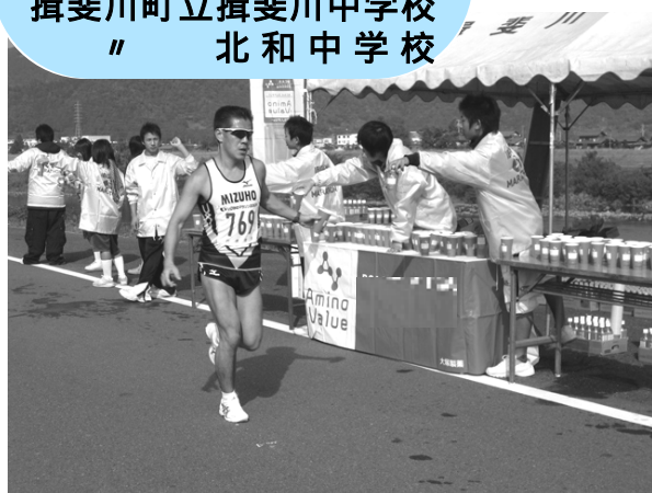
「いびがわマラソン」でボランティア活動をする中学生と高校生