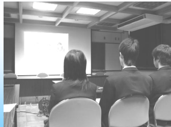
テレビ会議システムによる八百津高と八百津東部中との生徒間交流

相手の考えや思いを理解し自分の言葉で伝えることが、人と人とのつながりを深めます。