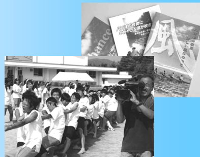
町内へ高校の体育祭の様子を放映