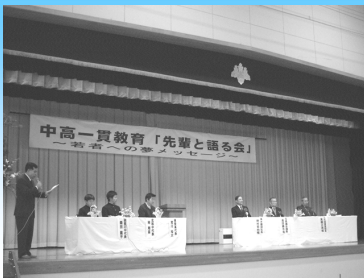
先輩と語る会（西濃地区）

社会の第一線で活躍している先輩を招き、自分の生まれ育った地域や学校のこと、実社会での経験談を聴きました。生徒は、改めて地域や自分たちの学校に対する思いを深め、共に学び共に活動するとき、人と人とのつながりが大切であることを学びました。（西濃地区）