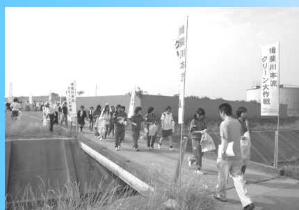
「揖斐川本流クリーン大作戦」でボランティア活動をする中学生と高校生

揖斐川町の行事（「揖斐川本流クリーン大作戦」や「いびがわマラソン」など）に中学生と高校生がボランティアで参加しています。中学生と高校生がそれぞれ役割を分担して、一緒になって活動します。