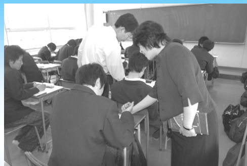
中学校と高校の教員によるTTの授業(西濃地区)

中学校と高校の教員がそれぞれの特長を生かすTT(ティーム・ティーチング)の授業を行うことにより、きめ細かい指導を充実させています。