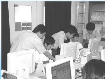
体験入学で中学生にコンピュータの操作方法を教える高校生（八百津高）