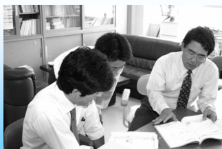
中学校と高校の教員による打合せ(可茂地区)

中学校と高校の教員がそれぞれの特長を生かすTT(ティーム・ティーチング)の授業を行うことにより、きめ細かい指導を充実させています。