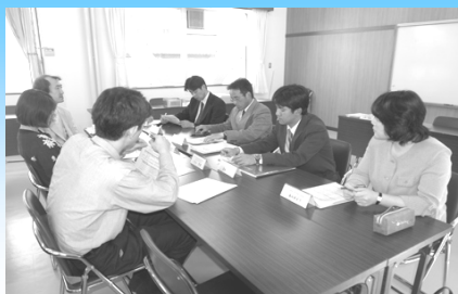
教科教育研究会(西濃地区)

さらに、教科教育研究会を定期的に関き、生徒の学習状況を把握し学習指導に生かしています。(西濃地区)