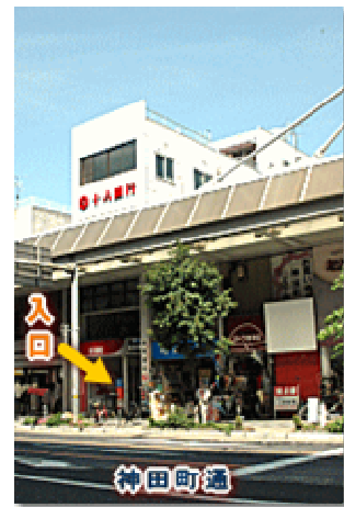
ぎふまちづくりセンター全景

地域に関する調査研究やデータ収集をする「シンクタンク機能」、まちづくりに関する相談や組織づくりをお手伝いする「サポート機能」、学習会や公開セミナーなどを通じて、教育や提言を行う「プレゼンテーション機能」、知的、人的ネットワークの提供を行う「ネットワーク機能」、まちづくりの人材発掘および育成を行う「クリエイティブ機能」などの機能・役割を有し、岐阜圏域のまちづくりに貢献している。