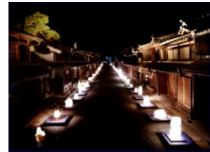
美濃和紙あかりアート展

平成 11 年に重要伝統的建造物群保存地区に選定された「うだつの上がるまちなみ」を地域資源の核として、住民、団体、行政が連携した活動を展開しています。伝統産業である「美濃和紙」と「うだつ」の街並みを融合した「美濃和紙あかりアート展」は平成 6 年から始まり、今では来場者が 5 万人を超える一大イベントに成長しました。観光客の滞在時間や観光消費額を延ばすための更なる工夫が今後の課題です。