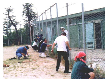
グラウンド整備、フェンス補修の様子

地元中学校のテレビ出演に際し、ボランティアで関わった地域の父親たちが「子供達の健全な成長を見守ろう」と活動をスタートしました。当初は中学校の部活動交流が中心でしたが、現在は学校内の草刈り・校舎の簡易修繕支援、子ども達の商業体験サポート、青少年の健全育成と安全を図るための夜間パトロールなど幅広い活動を行っています。平成15年にNPO法人化、得意とするIT技術を活かして、事故・事件発生情報を希望者及び各地域の関連機関に自動配信するシステム「安全情報特急」（ http://www.anshin-anzen.net/oyazi/ ）を開発・運用しています。