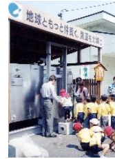
「いびがわみずみずエコステーション」の堆肥化ステーション

商店街の空き店舗を活用して「環境の駅」を設置・運営し、空き缶回収や生ゴミの堆肥化に取り組み、回収協力者へは域内の商店などで利用できるクーポン券を発行するなど、商業振興と資源問題を上手く結びつけた活動を行っています。