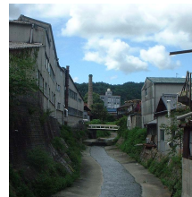
駄知町の工場風景

地元住民や行政等との連携を深め、産業観光による地域の活性化への取組を今後すすめていきたいと考えています。