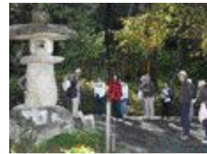
ウォーキングコースの整備活動の様子

恵那市まちづくりの事業の実行組織（地域協議会で企画した事業の実行を担う組織）として位置づけられていますが、武並町は昭和29年の8町村合併による恵那市誕生以来、地道なまちづくりを重ね、平成7年には自治会や目的別地域活動団体を巻き込んだ「武並町まちづくり町民会議」が設立されており、自立的なまちづくり組織が既に存在していました。このため、新恵那市の地域づくり事業にも既存の部会活動に新たな活動を負荷する形で、スムーズに対応しています。