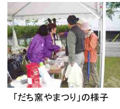
「だち窯やまつり」の様子