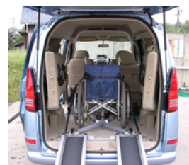
福祉車両の提供サービス

地元貨物運送業者が協同組合内で行った新規事業を具現化し、少子高齢化の時代に対応するいわゆる便利屋事業(東濃デリバリーサービス)を平成14年に開業、市民からの出資も募り、平成15年に会社を設立しました。乗務員がドアを開ける「ドアサービス」の実施、環境にやさしいハイブリッドカーの導入、福祉専門家を雇用し社内に福祉事業部を設置(訪問介護事業者認定)、便利屋事業部を設置し、買い物代行、草刈り等の生活支援サービスを提供するなど、生活者の視点から移送サービスを行うコミュニティビジネスに取り組んでいます。