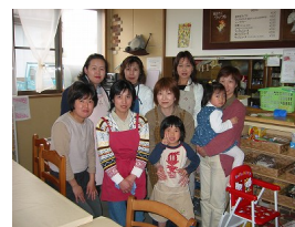
Mama's cafe とメンバー

「子どもと一緒に働ける場所」を基本理念に、子連れでも気軽に来店できる喫茶店を運営しているのが、NPO 法人「Mama's cafe」です。子どものプレイスペースを備えた店内や、好き嫌いのある子供向けメニューの提供など、子育て中の母親の視点を活かしたサービスで、子育て世代の交流・支援拠点となっています。