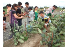
貸し農園の作業風景

地域の女性が主体となり、生ゴミの堆肥化やそれを利用した貸農園の管理・運営など資源循環型社会を目指した実践的な活動を展開しています。この団体は、地縁的な団体である輪之内町の婦人会の活動が発展して設立されたものです。地域住民の理解の促進・活動への積極的な参加の呼びかけや、継続的な取組に向けて若手の人材の育成・確保が今後の課題となっています。