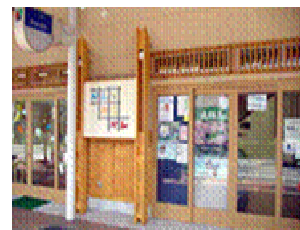
まちひとぶら座・かんかこかん

「飛騨高山まちづくり本舗」は、市民と商店街によって運営されており、「こころを育む」「人と人との関係を育む」「地域と人との関係を育む」を活動の柱として、まちづくり活動のための様々なイベントが企画・開催されています。また、「まちづくり通信」を発行するとともに、だれでも気軽に立ち寄っていただける「まちの縁側」として「まちひとぶら座・かんかこかん」を設置し、様々な地域と人がつながる「場」づくりを進めています。