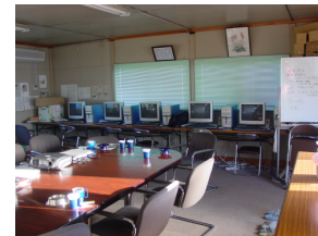
NPOまちづくり山岡 パソコン教室会場

山岡町では、市町村合併後も個性あるまちづくりを継承していくため、町の全世帯（人口5,500人・1600世帯）が加入して、まちづくりNPOを平成15年に設立し、合併後の地域の担い手として活動する目的で「まちづくり山岡」を発会しました。イベント事業、健康づくり事業、環境美化事業、ボランティア活動に対する助言・援助事業をすすめています。恵那市まちづくりの事業の実行組織（地域協議会で企画した事業の実行を担う組織）として位置づけられています。