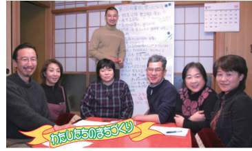
下呂市の広報に掲載されたミニコミ誌編集の様子

合併後の地域コミュニティ維持に危機感を持つ市民の有志が集まり、日頃感じることやまちづくりへの提言などを掲載したミニコミ誌を3ヶ月に1回発行しています。地域の伝統的な食文化をテーマにしたイベント「朴葉ずし祭り」を地域の人々との協力の下で開催するなど、地域に根ざした活動を育てています。