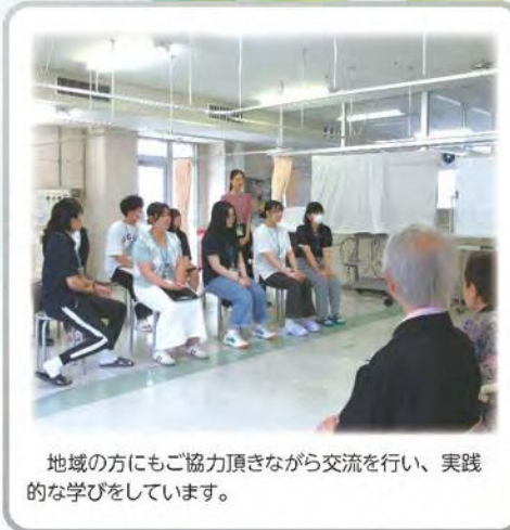
地域の方にもご協力頂きながら交流を行い、実践的な学びをしています。