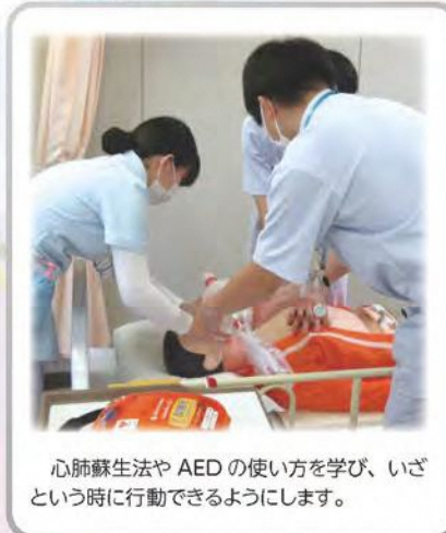
心肺蘇生法や AED の使い方を学び、いざという時に行動できるようにします。