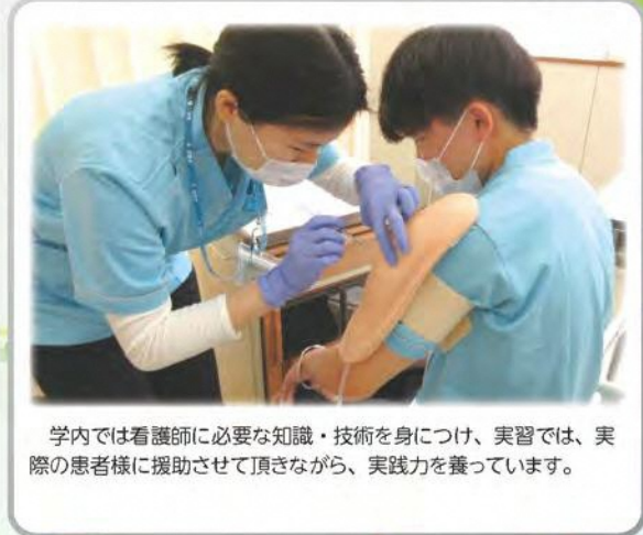
学内では看護師に必要な知識・技術を身につけ、実習では、実際の患者様に援助させて頂きながら、実践力を養っています。