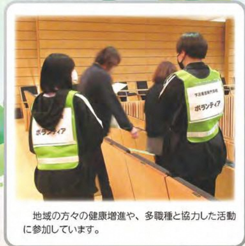
地域の方々の健康増進や、多職種と協力した活動に参加しています。