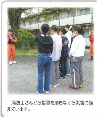
消防士さんから指導を頂きながら災害に備えています。