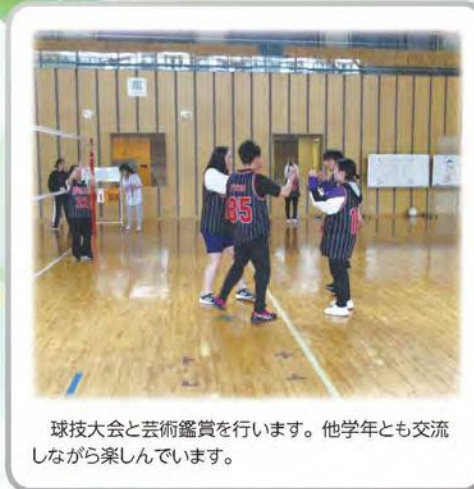
球技大会と芸術鑑賞を行います。他学年とも交流しながら楽しんでいます。