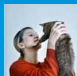
長島 有里枝 アーティスト／写真家／文筆家