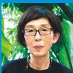
妹島 和世 建築家／SANAA 共同主宰／ 東京都庭園美術館館長