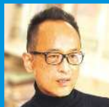
土方 明司 川崎市岡本太郎美術館館長／ 武蔵野美術大学客員教授