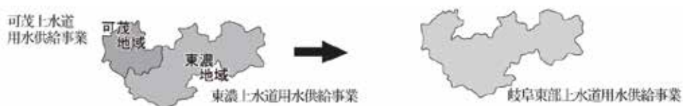
事業統合のイメージ図

なお、給水規模は、創設当時の6市4町の約28万人から、約48年を経過した現在は、7市4町の約45万人の水道水を供給するまでに至っている。