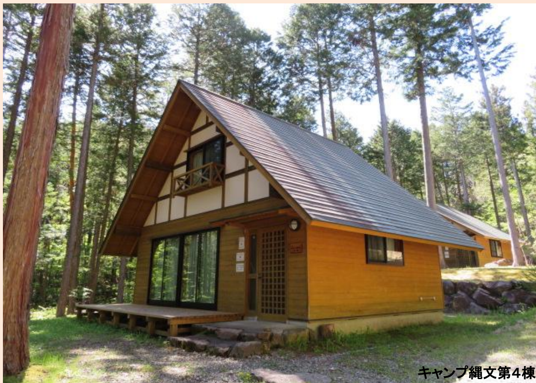
キャンプ縄文第4棟

心身をリフレッシュすることを目的としたコテージです。 ネットやテレビはないけれど、森と谷川に囲まれた環境を体験できます。