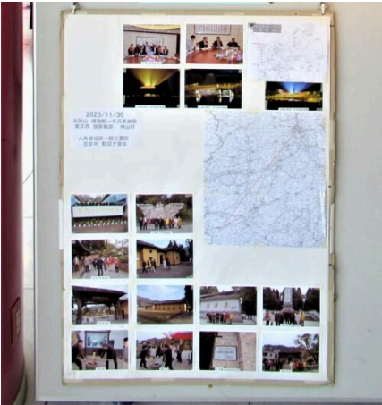
<団体サポーター：特定非営利活動法人 ぎふ多胎ネット 様>