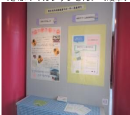
＜清流の国ぎふ女性防災士会さん＞＜クローバ！さん＞