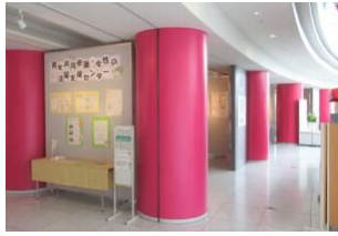
＜男女共同参画に関する年表＞