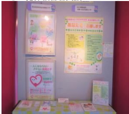
＜ぎふママカレッジさん＞＜岐阜アドラー心理学研究会さん＞

また、初めての試みとして男女共同参画推進サポーターの活動紹介のコーナーも設け、6団体に出演していただきました。 ＜ぎふ犯罪被害者支援センターさん＞＜岐阜県ひとり親家庭等就業・自立支援センターさん＞