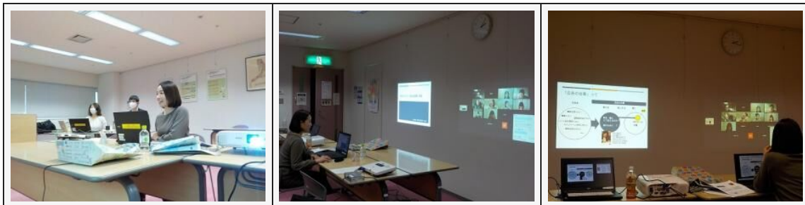
【第3回 男女共同参画推進サポータースキルアップ講座】

参加者からは、「キャッチコピーを作るときに、一番大切なのは対象者への理解と愛だということがとても印象に残りました。」「自分が思っている広告の書き方とは違う別の視点からの広告の書き方が学べたところが良かったです。」「相手を深く想うことが広告コピーを考える基本であることがわかりました。」という感想をいただきました。