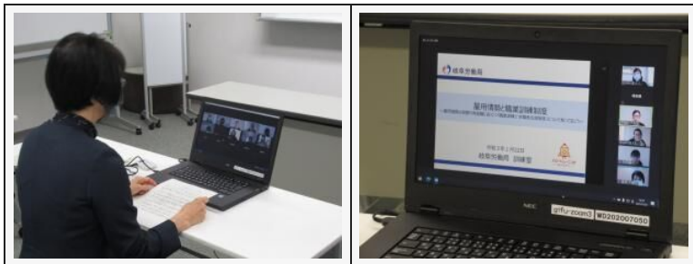
【1月22日 マインド&スキルアップ講座】

参加者からは、「スキルアップのために職業訓練を受講したいと強く思いました。ハローワークに職業訓練が受講できるかすぐに相談に行こうと思います。」「職業訓練は今まで経験してこなかった業種にも挑戦でき、自分の可能性を広げるよい機会になると思いました。」「事務職の中でも、求人倍率が違うということが分かりました。」という感想をいただきました。