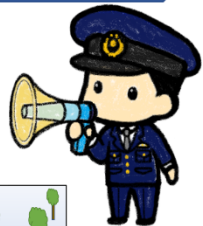
法定速度が30km/hになる道路の具体例

生活道路における自動車の法定速度が 60km/h → 30 km/hに引き下げられます!!