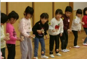
真剣にけん玉の技を披露する園児