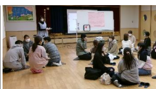
和やかな雰囲気での交流会