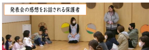
発表会の感想をお話される保護者

発表会の感想を聞いた園児たちはとてもうれしそうでした。園児、先生、保護者の素敵な関係が垣間見えた瞬間でもありました。