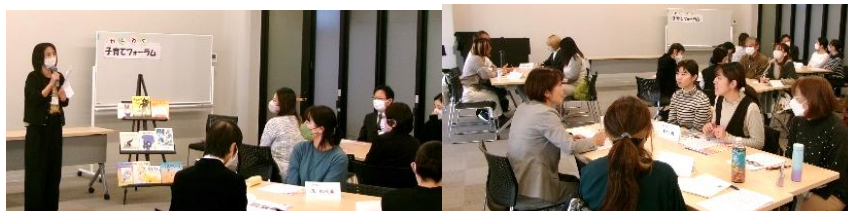
家庭教育指導員のお話を熱心に聞き、グループ交流をする参加者のみなさん

後半は、交流会「楽しい子育てを広めよう」として保護者と行政担当者の意見交換会が行われました。少人数で、和気あいあいとした雰囲気の中、自由に意見が交わされていました。過去、この話し合いから、「子どもの一時預かり」のしくみができあがったそうです。今回、参加者の意志の疎通も進み、夢のある意見の交流もなされていました。