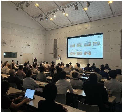
＜企業向けセミナーの様子＞