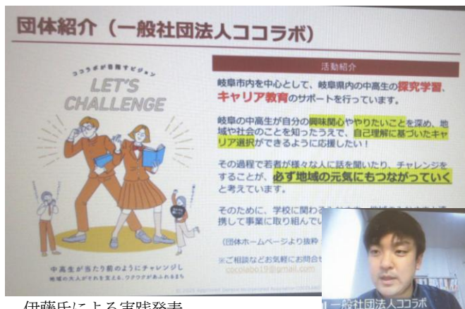
伊藤氏による実践発表