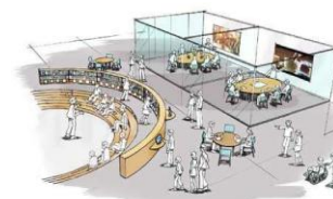
▲土岐市文化財保存活用拠点 (仮称) 整備事業

土岐市 総務部 行政経営課 Tel 0572-54-1145 (直通) 〒509-5192 土岐市土岐津町土岐口2101 Fax 0572-54-1127 E-mail gyoukei@city.toki.lg.jp