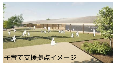
子育て支援拠点イメージ

地域経済の活性化、転出抑制と出生率の向上を図り、将来における人口減少を抑制するため、「まち・ひと・しごとの創生と好循環の確立」を目指し、「若い世代の結婚・出産・子育ての希望をかなえる」「雇いを維持・創出する」「関ヶ原への人の流れをつくる」「魅力的な地域をつくる」を目標に掲げ、各種事業を推進しています。