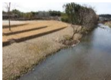
令和2年3月に完成した河川公園『とみぱーく』

富加町 企画課 企画係 〒501-3392 富加町滝田1511 Tel 0574-54-2111(直通) Fax 0574-54-2461 E-mail kikaku-g@town.tomika.gifu.jp