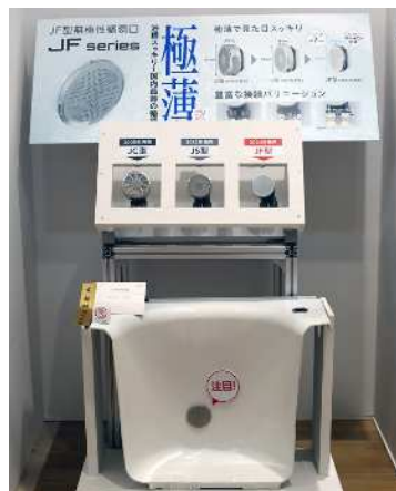
『JF 型無極性循環口』 株式会社オンダ製作所