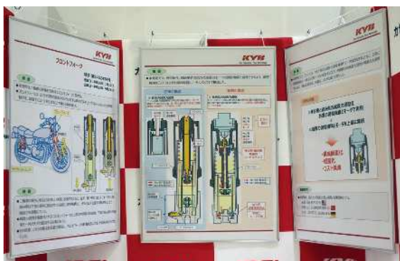
『減衰力調整式フロントフォーク』 カヤバ株式会社