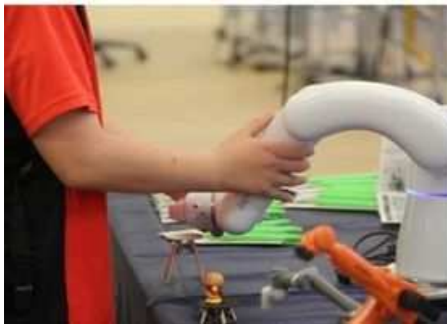
親子しごと体験業 (ロボット操作体験)