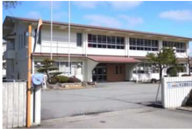
岐阜県立木工芸術スクール