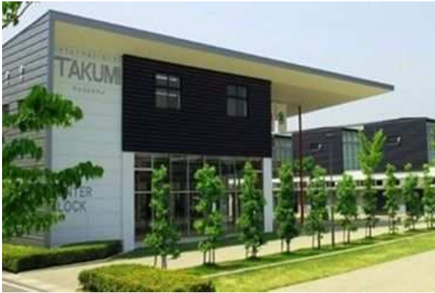
岐阜県立国際たくみアカデミー