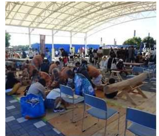
第21回ぎふ技能フェスティバル (木の椅子づくり・丸太切り体験)