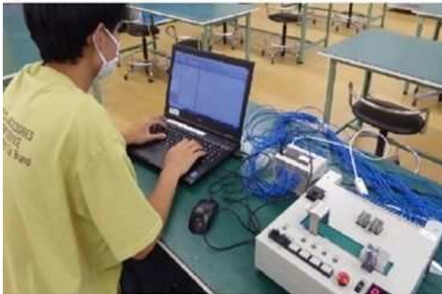
生産技術科（国際たくみアカデミー）