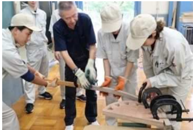
木工科（木工芸術スクール）