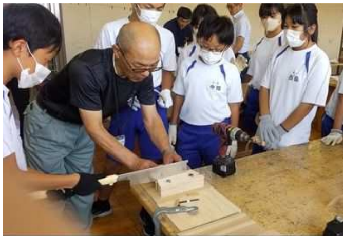
未来の技能者育成事業 (家具製作・曲木の体験授業)