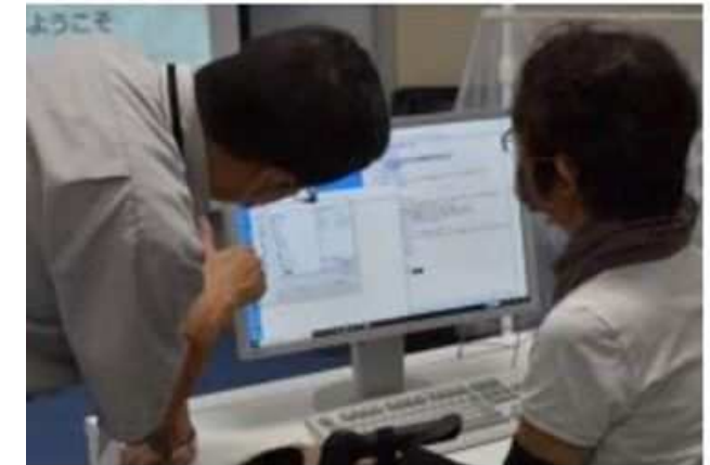
Webデザイン科（障がい者職業能力開発校）