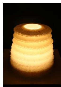
第30回 一般部門 ライトアップ賞「七重塔」