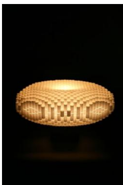
第30回一般部門 大賞 「光の入物」