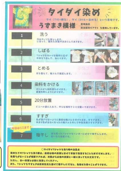
学級長さん作成の染め方説明書