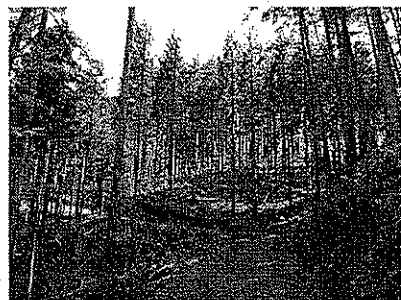
間伐が実施された森林

(款) 6 農林水産業費 (項) 5 林業費 (目) (6) 森林整備費 (明細書事業名) ○公共事業 森林整備事業費補助金 他