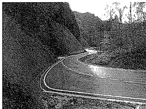
山村地域の振興に資する林道

(款) 6 農林水産業費 (項) 5 林業費 (目) (4) 林道費 (明細書事業名) ○公共事業 林道事業費 他