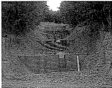
人家を守る治山施設