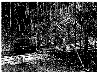
搬出間伐の実施状況