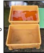
推奨される踏込消毒槽の設置方法！ ②消毒液の槽 ①水洗の槽