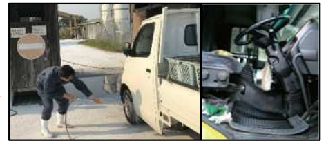
車両はタイヤだけでなく、 泥よけの内側まで消毒 し、 フロアマットの交換やペダル等車内も消毒