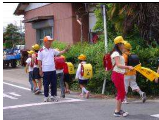
（子どもの見守り活動）