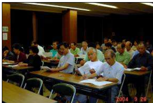
(設立総会 平成16年9月26日)