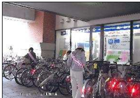
(自転車点検カード取付活動)