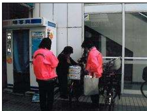
(ひったくり予防自転車かごネットかけ指導風景①)