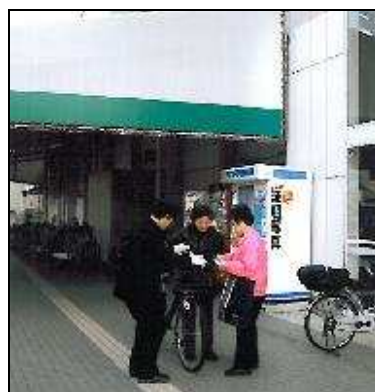
(ひったくり予防自転車かごネットかけ指導風景②)