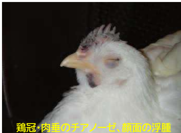
鶏冠・肉垂のチアノーゼ、顔面の浮腫

① 同一の家きん舎(鶏舎)において、1日の家きんの死亡率が当日から遡って 21日間における平均死亡率の2倍以上