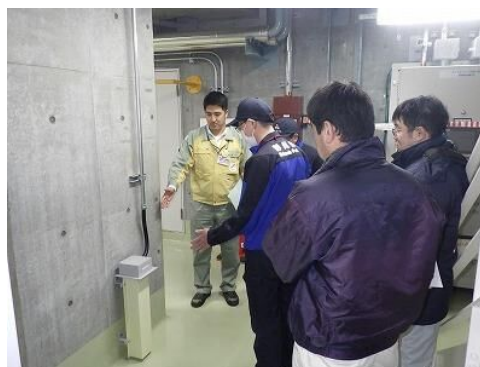
緊急時対策所内に設置した漏えい検知器を点検している様子

注1 自主的に取り組んできた重大事故対策や、2013年7月に施行された原子力規制委員会の新規制基準を踏まえ追加した対策工事などのことです。