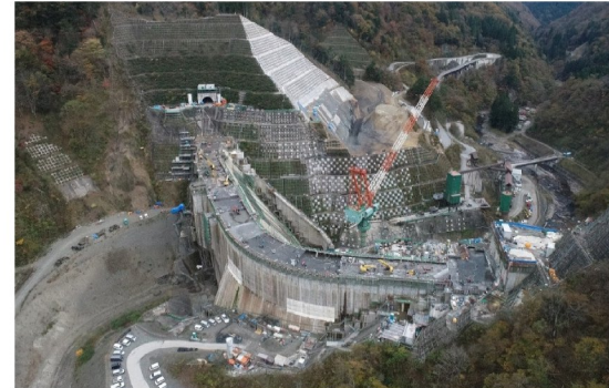
③ ダムサイト左岸状況(右岸上空より望む)