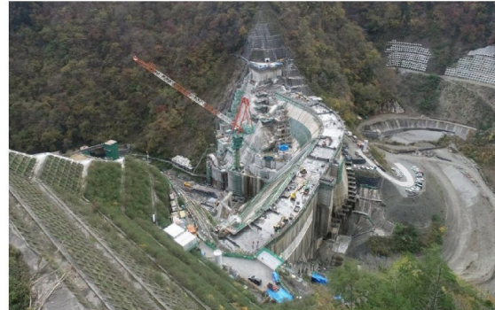
② ダムサイト右岸状況(左岸上空より望む)