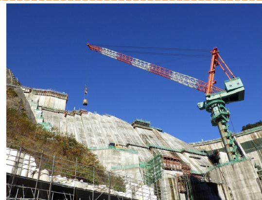
堤体打設(タワークレーン)