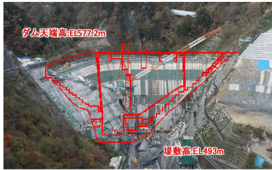
① ダムサイト状況(下流上空より望む)